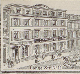
Lange Str. No 11