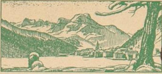
SILVAPLANA / Engadin

Postka Carte postale Cartolina postale BRIEFVERSAND