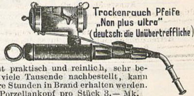
Trockenrauch Pfeife „Non plus ultra“ (deutsch: die Unübertreffliche)

New York: 52 East Union Square. — Paris: 22 Rue de l'Entrepôt. — London: 1/6 Holborn-Circus, EC.