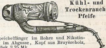
Kühl- und Trockenrauch-Pfeife

aus verzinnem Metall und Aluminium, ist die beste Jagd-, Feld- und Arbeitspfeife, ohne Verschraubung, von nahezu unbegr. Haltbarkeit, pro Stück 3,30 Mk.