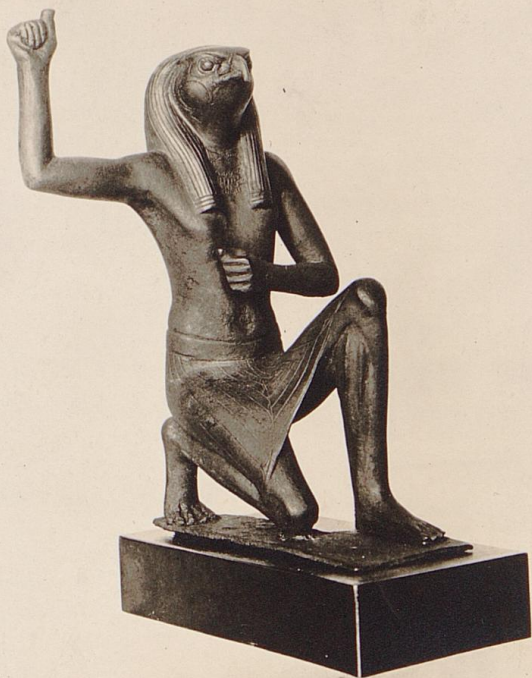
EGYPTIAN STATUETTE OF A MINOR GOD ABOUT 600 B. C. THE NEW YORK HISTORICAL SOCIETY