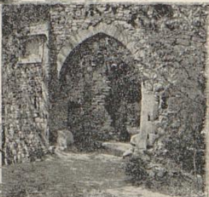
Front des alten Hauses. H. LAUBE, GÖTTINGEN