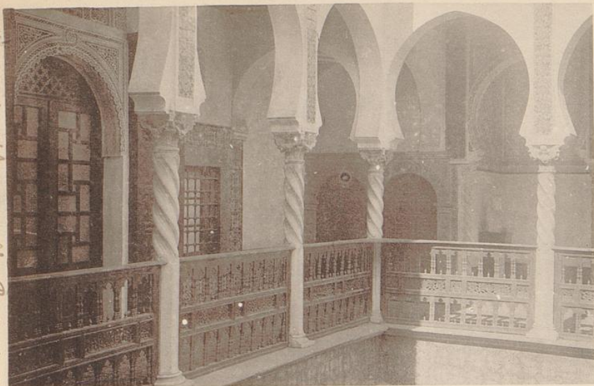
ALGER. -- Palais de l'Archevêché -- Galerie Mauresque, côté Nord

am Thüre nach nicht gezeichneten R. 20.11.05.