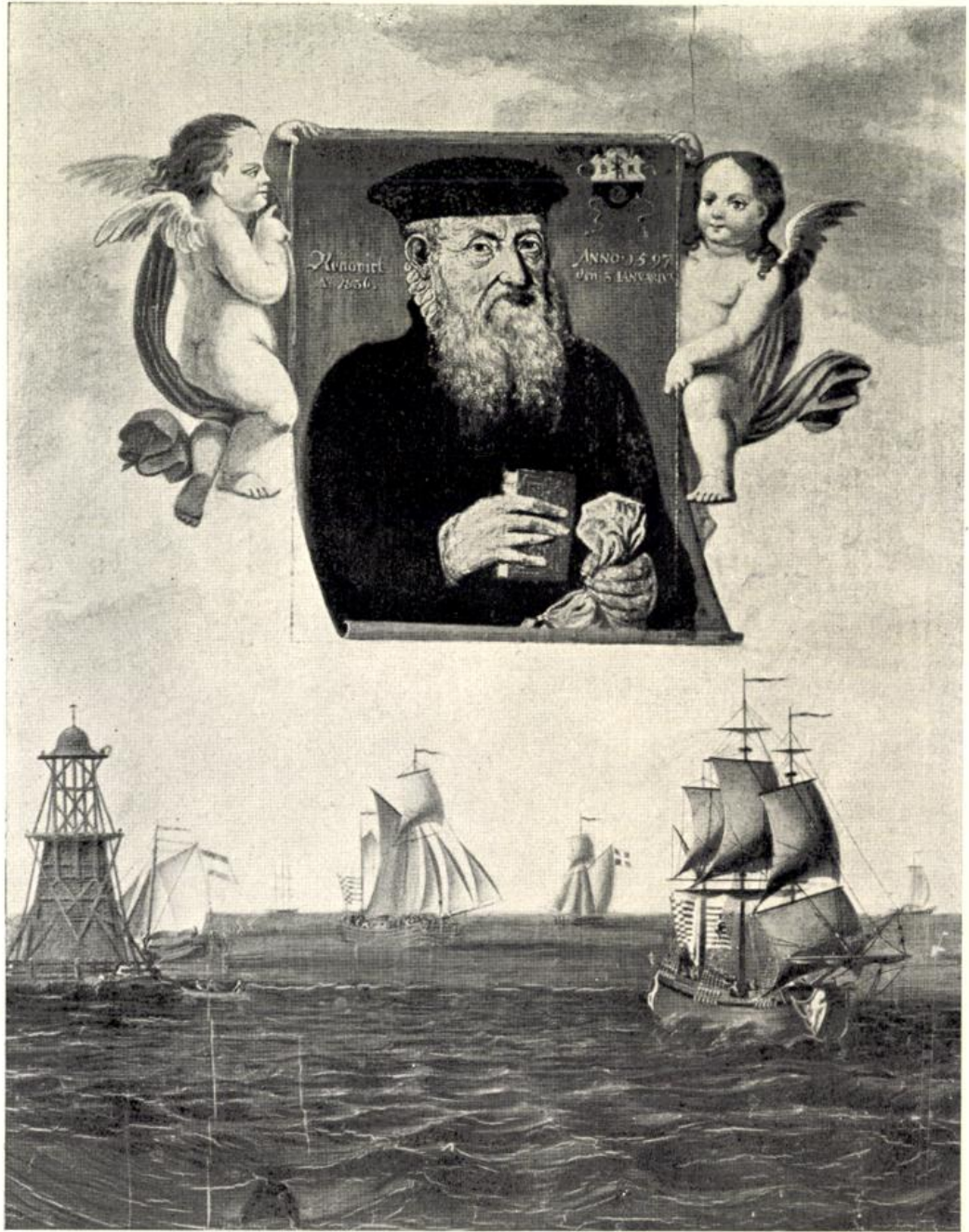
Nach dem Original im Hause Seefahrt.