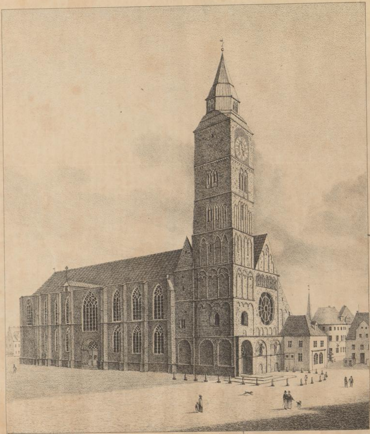
ANSICHT DER DOMKIRCHE IN BREMEN.