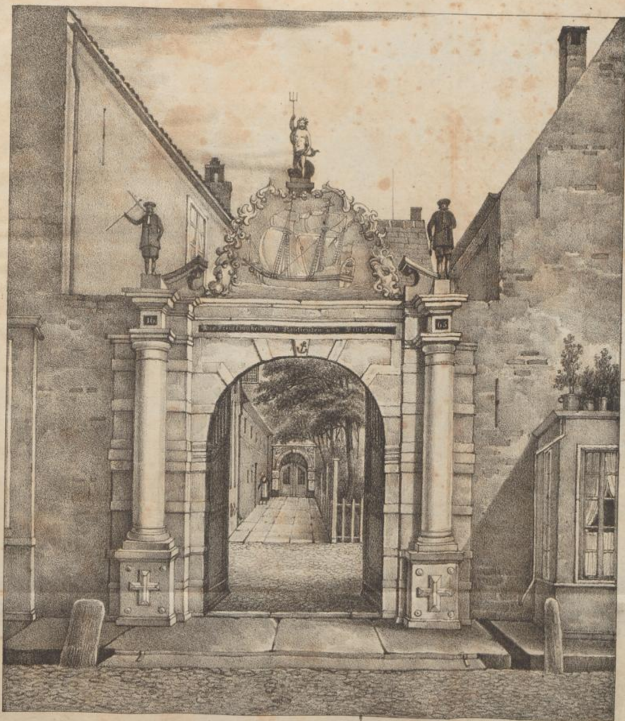
ANSICHT VOM HAUSE SEEFART IN BREMEN.