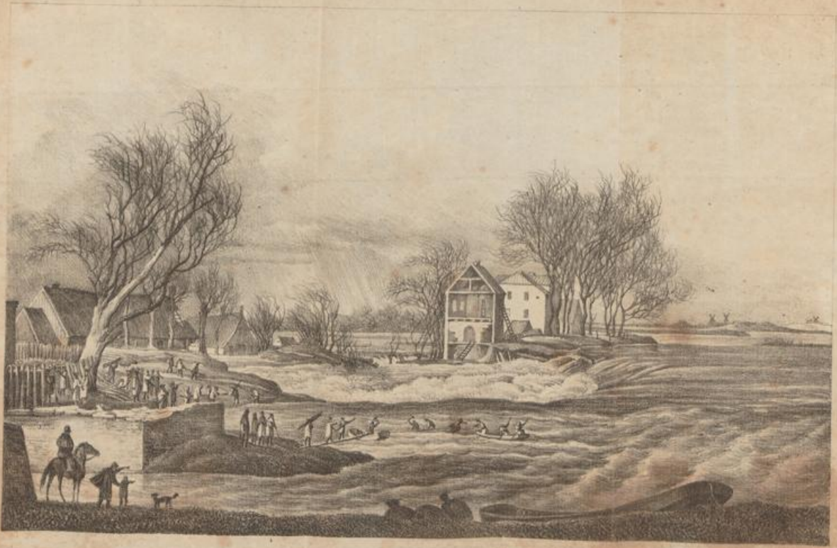
Ansicht der Deichbrüche bei Bremen den 6. März 1827