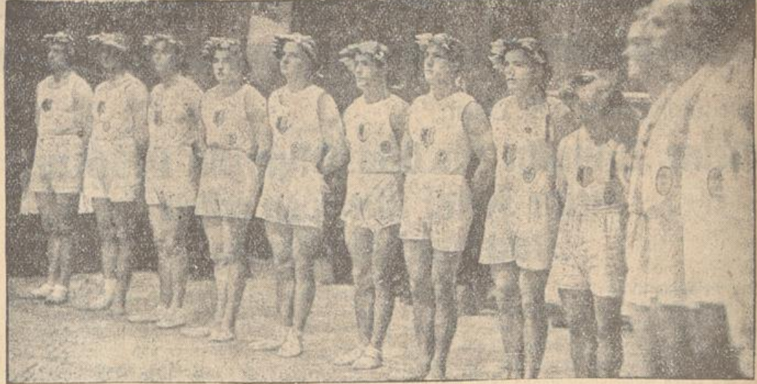
Die Sieger im Städtelkampf Die siegreiche Leipziger Mannschaft, die mit 2456 Punkten den Dreistädtekampf Hamburg-Leipzig-Berlin gewann