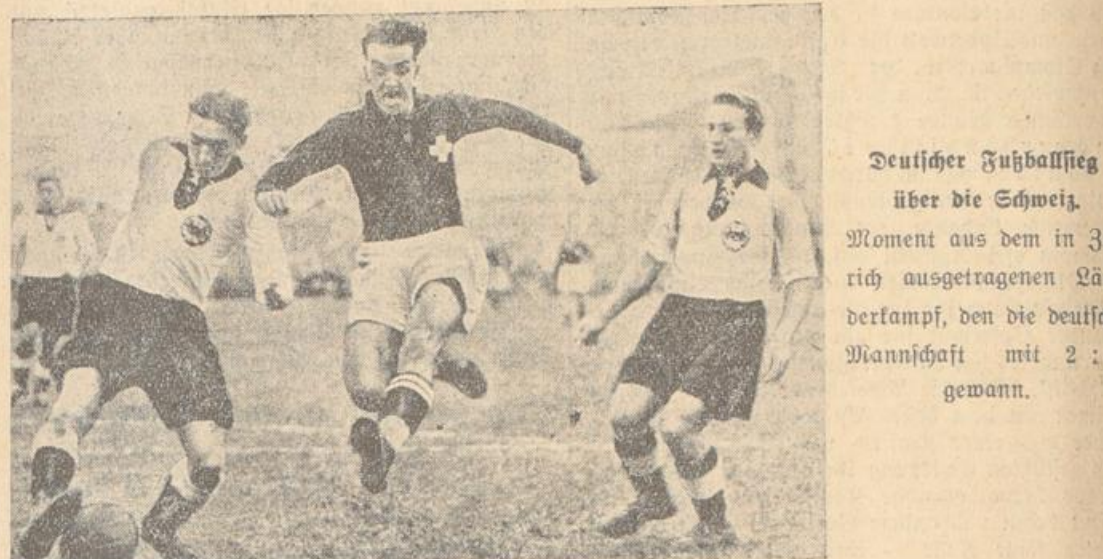
Deutscher Fußballtag über die Schweiz. Moment aus dem in Zürich ausgetragenen Länderkampf, den die deutsche Mannschaft mit 2:0 gewann.