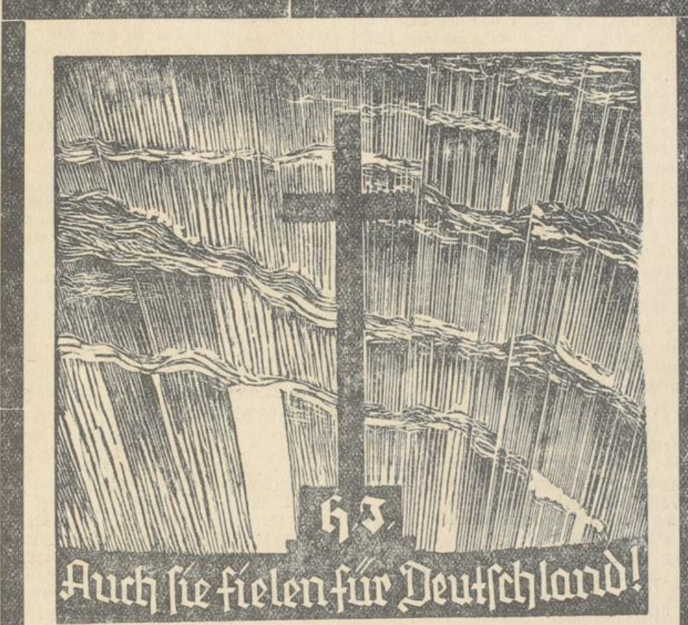
Im Kampf um Deutschland ließ ihr junges Leben die unsterbliche Gefolgschaft der HJ.

ben deutscher Jugend und wir, Hitler-Jugend, wollen sie der Erinnerung unserer 21 gefallenen HJ.-Kameraden weihen. So wie Herbert Norkus im Kampfe fiel, haben noch 20 andere Kameraden ihr Blut dahingegeben, damit der Geist unserer Bewegung zum Siege kam. Die Namen dieser jungen Helden künden nun diese Ehrentafel jedem Besucher, der in unserer Gebietsführerschule seinen Einzug hält. Ihr toten Kameraden, wir geloben Euch an dieser Stätte und in dieser Stunde, daß wir immer Euren Geist in unseren Herzen tragen wollen. Ihr seid die Wegbereiter unserer Bewegung. Wir wollen, wenn es uns das Geschick vergönnt, das Werk vollenden. Wir schwören es Euch zu: Ihr lebt in uns und durch uns ewig in der deutschen Jugend!