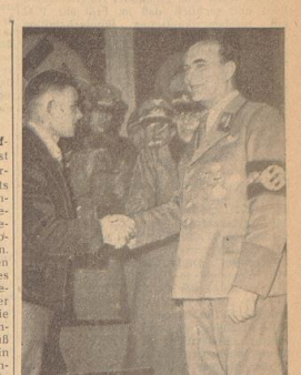
Der millionen Deutsche im Wartheland. — Im Zuge der gemeinschaftlich durchgeführten Umsiedlung der Schauerzonen-Deutschen im Reichs Wartheland ist die Zahl der Deutschen in diesen Gebieten auf eine Million gestiegen. Gauleiter und Reichsstatthalter Greiser empfing den millionen Anwanderer. — Unser Bild zeigt den Gauleiter begrüßt den Siedler mit Handschlag.

Ämliches Verkündungsblatt des Reichsstatthalters in Oldenburg und Bremen Einzelpreis 15 Rp.