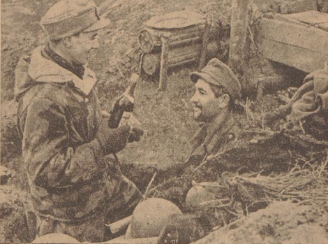
Er fand einen Brief im Brot. Im sechsmillionsten Brot ...