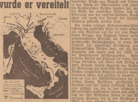
Der deutsche Gegenangriff

Die beiden erzielten Dokumentenvereinfachungen von arabischer Seite ist nichts anderes als eine Reaktion auf die Deflation dieses Krieges von England immer wieder unermesslichen Verluste, die Araber durch gezielte Verpfändungen in deren Mittelpunkt die angelegte Errichtung eines Großarabischen Reiches steht, auf die Seite Englands und damit auch der USA, und der Sowjetunion herüberzuführen. Genau diese Verpfändung hat England im ersten Weltkrieg betrieben und damit auch Erfolg gehabt. Damals konnte England den Arabern die Befreiung von dem Joch des osmanischen Reiches vorkaufen. England glaubte damals besonders leicht und gerillt zu handeln, in dem es eine der Schlüsselstellungen der arabischen Frage, Palästina, gleichzeitig den Arabern und den Juden verpfändet. Das letzte gelang, um die in den Ländern der Welt im Mittelmeer lebenden Juden und nicht mehr als fünf Millionen Juden aus den letzten einigten Staaten, die ja den Resten der Welt in den Händen haben, ganz in ihre Kriegssacke einzupacken.