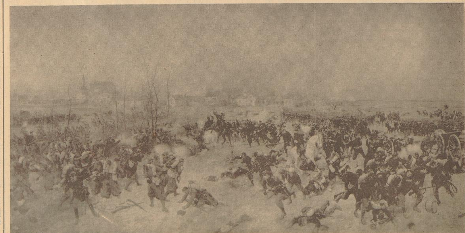
Die 75er in der Schlacht bei Loigny am 2. Dezember 1870. Gemälde von Wilhelm Hünten.

Ein freudiges Ereignis brachte der Weihnachtsmonat 1916 für Bremen. Am 10. Dezember kam das Gode des untern Kreuzers „Deutschland“ von seiner kommissarischen Amerikareise zurück. War der Empfang diesmal auch nicht so geräuschvoll wie bei der ersten Heimkehr, so freute man sich doch, das glückliche Schiff nun wieder in den hiesigen Hafen zu wissen. Die letzte Kriegsweihnacht des ersten Weltkrieges (1917) brachte die Herausgabe des ersten „Notgeldes“ in Bremen. Am Silvesterabend des ersten Weltkrieges konnte man sich über den Ort einer Ausgabe solcher Geldstücke nicht entschließen. Das war das erste Anzeichen des beginnenden Niederganges, den der Führer nach hartem, kompromittiertem Einsatz in letzter Stunde aufhalten hat. Der Wandel sei nun fast zehn Jahren ist uns allen voll bewusst geworden, aber vor dem Frieden, den wir gewinnen wollen, steht der Kampf, und so läßt uns das Weihnachtsfest 1917 entschließen, unerschütterlich sein selbst, unter Pflicht zu tun, jeder an dem ihm zugewiesenen Platz und nach bestem Können und Vermögen. Alles für uns unter Deutschland! Fritz Peters