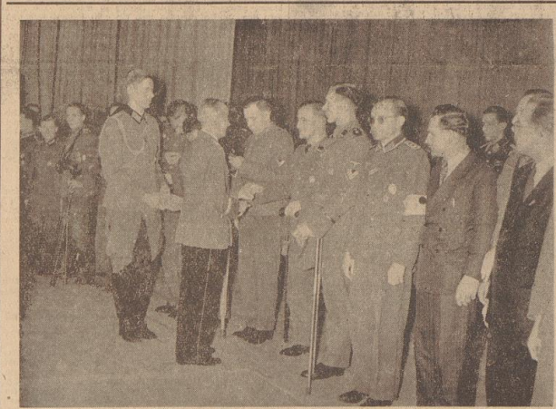
Die erstmalige Verleihung des Versicherten-Sportabzeichens im Kuppelsaal des Reichsportfeldes. Unser Bild zeigt den Reichsportführer von Tschammer und Osten bei der Überreichung der Sportabzeichen an die Versicherten, über die wir ausführlich berichteten.

Berlin, 2. Dezember. Das erbitterte Ringen um die Vorherrschaft, das zwischen den Blatländern der Vereinigten Staaten und Großbritannien im Gange ist, wird in der letzten Zeit noch einmal in einem heftigen amerikanischen Gegenangriff im Bereich des Ozeans im Nordatlantik im Herbst des Jahres 1940 nach dem Scheitern der ersten Versuche, die Kontrolle über die Nordatlantische Ozeanstraße zu gewinnen, wieder aufgeführt. Nach dem völligen Zusammenbruch Frankreichs und über ein Jahr vor dem Beginn der Operationen, die die Kontrolle über die Nordatlantische Ozeanstraße zu gewinnen, wieder aufgeführt. Nach dem völligen Zusammenbruch Frankreichs und über ein Jahr vor dem Beginn der Operationen, die die Kontrolle über die Nordatlantische Ozeanstraße zu gewinnen, wieder aufgeführt.