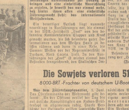
Die Sowjets verloren 51 Flugzeuge 8000-BRT-Frachter von deutschem U-Boot im Atlantik versenkt