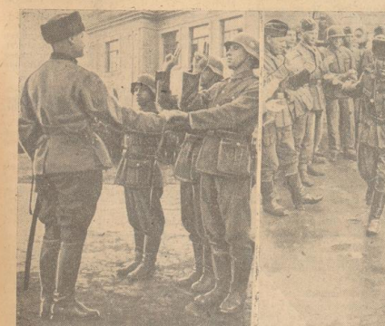
Sie schwören dem Führer die Treue, Freiwillige aus den Reihen der Ostvölker werden auf den Führer vereidigt, ...

„Look“ und Sumner Welles über den Plan einer jüdischen Weltregierung — Atlantik-Charta liquidiert