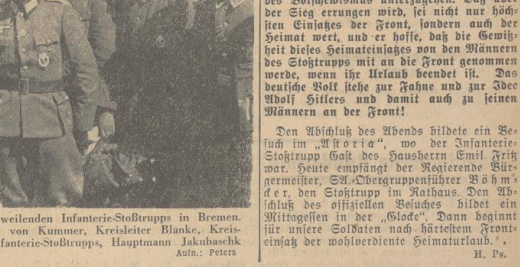
Empfang des im Gau Wees-Emm zu Gast weilenden Infanterie-Stoßtrupps in Bremen.