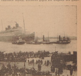
Das erste deutsche Dampfschiff „Die Weser“ auf Probefahrt am 6. Mai 1817. — Rechts: Der Schnell-Dampfer „Bremen“ auf der Fahrt weserwärts vor Vegesack am 24. Juni 1929.

Zwei Jahre später nämlich die Unterwelt diesen Gedanken wieder auf. Bremen darf sich rühmen, das erste brauchbare deutsche Dampfschiff erbaut zu haben. Wohl hören wir aus den Jahren