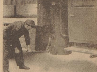
Borgward-3-Tonner mit Imbert-Holzgas-Generator

Der Weltkrieg ist an drei Fronten ausgetragen worden. An der Westfront, an der Ostfront und an der Mittelfront. An der Westfront, an der Ostfront und an der Mittelfront. An der Westfront, an der Ostfront und an der Mittelfront. An der Westfront, an der Ostfront und an der Mittelfront.