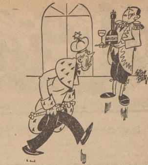
Zeichnung: Beck / „Alder und Studier“ „Rasch ein Whisky, haben schon wieder das Wort Sozialismus in den Mund nehmen müssen“

... hat man für die ... ... schnelle ... ... 10.000 BHP. neu verjehnt und damit Tonnagehöhg