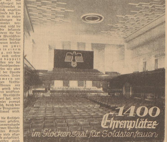
1400 Plätze im Glockensaal für Soldatenfrauen

... auf unsere Bremer Soldatenfrauen zum Wunschkonzert am 8. März