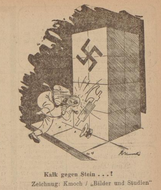
Kalk gegen Stein...!