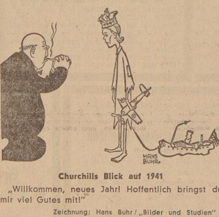
Churchills Blick auf 1941 „Willkommen, neues Jahr! Hoffentlich bringt du mir viel Gutes mit!“