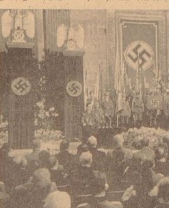
Der Staatstrauerakt für den Reichssportführer von Tschammer und Osten

Reichsminister Dr. Goebbels würdigte v. Tschammer und Osten, sein Leben und Schaffen