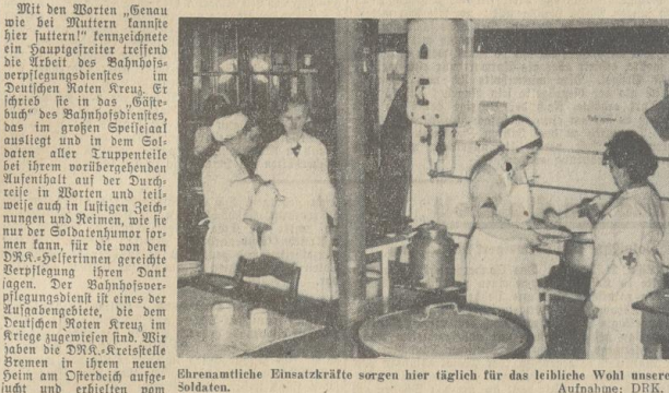
Ehrenamtliche Einsatzkräfte sorgen hier täglich für das leibliche Wohl unserer Soldaten.

Täglich werden 1200 Portionen warme Verpflegung und 1000 Liter Kaffee an Soldaten ausgegeben