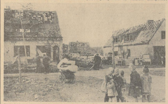
Fünf britische Fliegerbomben zerstörten oder beschädigten die Häuser einer Siedlung Bremens. Weshalb Volksgenossen fanden hier den Tod.

Wieder, wie bereits in der vorangehenden Woche und unzählige Male vorher, waren Siedlungsbauer am Stadtrand Bremens das Ziel heftiger britischer Fliegerangriffe. Auf einem verhältnismäßig sehr eng begrenzten Raum fielen fünf Bomben nieder, zerstörten oder beschädigten eine Anzahl von Häusern und vernichteten blühende Menschengüter. Eine juchzende Wahnstimmung alle über sollte das unverantwortlich luftschutzwidrige Verhalten einiger der Geschädigten führen. Wie haben eine gefürchtete Bäckerin, ihre Kellerräume waren unbeschädigt und luftschutzmäßig hergerichtet. Ein Teil der Bewohner des Hauses aber hatte sich im Anbau, in dem die Badstube untergebracht war, aufgehalten. Ein Volkstreffler traf wieder feinerlei Schutz gegen den Raum und verschüttete die in ihm wohnenden Bewohner, die in einen Tod fanden, der bei disziplinierterm Verhalten so vermeiden gewesen wäre. Nach leistungsfähiger aber hatten sich die Bewohner eines anderen Hauses verhalten, die vor ihrem Hause liegend, im Feldbereich die Bahn eines von Scheinwerferstrahlen erhellten Britenbombers verfolgten! Der genau auf sie auftommende Briten war es gewesen, der seine Bombenlast abgeworfen hatte, und auf der Hand der Tod seine Opfer. Angehörige dieser wahrhaft tragischen Umstände muß noch einmal der Auf erhoben werden, bei Fliegerangriffen auf alle Fälle die Luftschutzhüter aufzuheben.