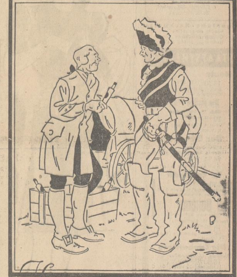
Kiste um Kiste sandte ich den Offizieren des alten Fritz und den Markietendern

Stellen-Angebote Gesucht 1 Lastkraftwagenfahrer