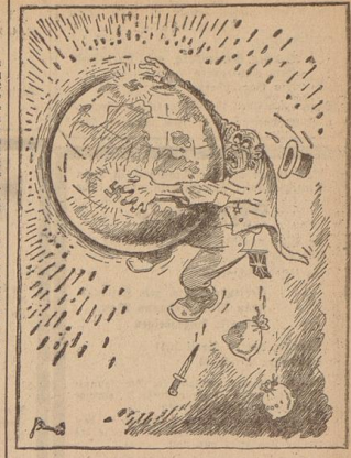
„Dammned, ich kann mich auf dieser Welt nicht mehr halten!“ Zeichnung: Balko („Bilder und Studien“)

Von Kriegsberichterstatter Christoph von der Rapp PK. .... 23. April. Die Gänge für den letzten untergegangenen. Der letzte Angriff ist nach dem, im Osten landenden die ersten Schiffe. Die Bomben haben über Plymouth, die letzten Schiffe, die letzten Schiffe, die letzten Schiffe.