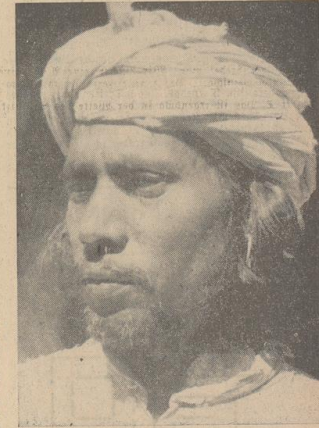
Typischer Inderkopf aus Banswara

Zwar hat auch er in Cambridge studiert und wurde — wie Gandhi und Nehru — Rechtsanwalt, doch haben ihm alle Lehren von englischer Seite nichts anhaben können. Als Leiter der Studentenschaft von Kalkutta erwarb er sich die praktischen Erfahrungen, die seinen klaren Blick für die Realitäten und Notwendigkeiten noch weiter schärfen. Viele Jahre hat er in englischen Gefängnissen verbringen müssen. Nach der ersten Haft wurde er nach Europa verbannt und lebte mehrere Jahre in Wien, wo er auch verbrieflich Berlin besuchte. Zu der Sozialen Freiheitspartei und ihrem Führer De Valera knüpfte er enge Beziehungen an. In dieser Zeit schrieb er eine Geschichte des indischen Kampfes, in der er sich offen mit Gandhi auseinandersetzt und dessen gewaltlose Methode verwarf. Schon vor dem Kriege erklärte er anlässlich des schwebenden