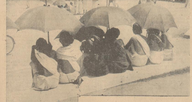
Links: Inder suchen Arbeit. Die Lohnbüros der großen Fabriken sind stets von Arbeitssuchenden umlagert.

Den Indern ist alles Tierleben heilig. In Kalkutta befinden sich auch zahlreiche Kultstätten der Jains, einer Hindusekte, die sich vornehmlich durch ihre Tieranbetung auszeichnet. Selbst schädliche Tiere, wie Schlangen und Skorpione, gelten als heilig und dürfen auch in der Abwehr nicht getötet werden.