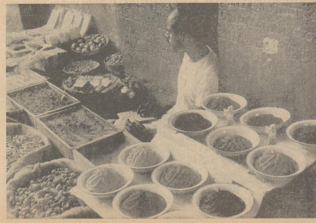
Rechts: An den Eingängen zu den indischen Tempeln hocken Händler, die Farbpulver verkaufen, die mit Wasser vermischt auf die Stirn aufgetragen werden und religiöse Zeichen formen