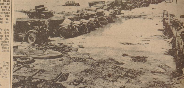
Im Hexenkessel von Dünkirchen hatten die Engländer Lastwagen ins Meer gefahren, um eine künstliche Landungsbrücke zu schaffen. Bei ihrem Fluchtversuch wurden sie von unseren Fliegern überrascht.