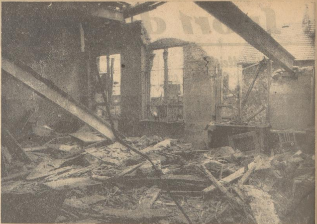
Völlig zerstört wurde das Kinderkrankenhaus Klein-Bethel. Unser Bild zeigt die verheerende Wirkung der auf dieses nur den Zwecken wahrer Nächstenliebe dienende Gebäude.

Dieser gemeine englische Anschlag auf die Anstalt Bethel ist schließlich nun vollends als brutales Verbrechen gekennzeichnet, weil man weiß, daß in diesem Umfange nicht ein einziges militärisches Ziel zu finden ist. Die Stadt Bielefeld ist voller Empörung über diesen neuen Anschlag der Engländer, der den Kranken und verwundeten Soldaten gilt. Aber sie und überhaupt jeder Deutsche hat das tiefste Mitleid. Die Engländer, die den Kranken und verwundeten Soldaten, die in der gleichen Weise getötet haben.