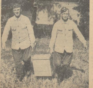
Linke: Diese „Bundeslade“ birgt die Pioniersprengkörper in einer Anzahl, die ausreichen würde, ein ganzes Bombendepot in die Luft zu jagen. Zwei weitere wichtige Geräte gehören noch außer den Schuppen, Spaten, Sonden, Hämmern, Beilen, Seilen usw. zu dem eisernen Werkzeugbestand des Sprengtrupps...