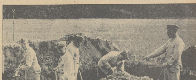
Bild rechts: Täglich auf neue setzen sie gleich unseren Frontsoldaten ihr Leben für die Sicherheit der schaffenden Heimat ein, wenn sie an die Freilegung eines Blindgängers oder — wer weiß es? — einer Langzeitzunderbombe gehen!