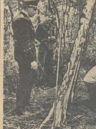
Die Birke hat den ersten Schlag abgewehrt. Mit der Sonde ist die Lage des Bombenkörpers festgestellt worden, er liegt ausnahmsweise nur knapp einen Meter tief im Boden.