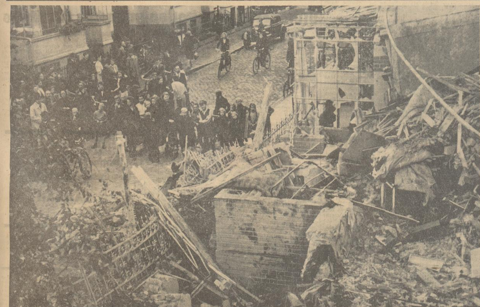
Wie auch unser Bildbericht im Innern des Blattes zeigt, bombardierten die britischen Luftgangs-erwahl- und planlos reine Wohnviertel Bremens. Die Aufnahme von einem Hause im Westen der Stadt, das einen Volltreffer erhielt, enth6lft das Abscheuliche ihrer ungeheuerlichen Untat.

Der 1. Zeppelinflug-Modellbauwettbewerb f6r Bremer K6dler wurde abgeurichteten.