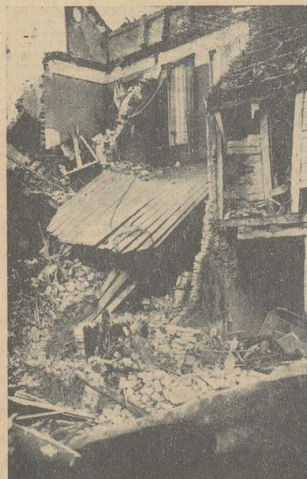
Bild ganz rechts: Hier in diesem Hause einer Neustädter Bäckerei gab es zwei Todesopfer. Die ums Leben gekommenen waren — trotz aller öffentlichen Warnungen — nicht im Schutzraum. Die Bombe riß die ganze Hutterfront auf. Die Betten des Schlafzimmers drohen abzustürzen.