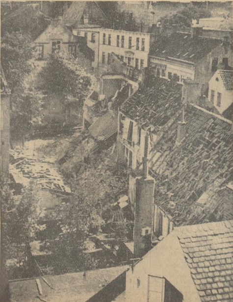
Links nebenstehend: Auch bei dieser Aufnahme der Schadensstelle im Sl-Weg ergab sich die Gelegenheit, einen erhöhten Standpunkt zu finden, von dem man einen weiten Ueberblick über die Umgebung hatte. Reines Wohnviertel!! Unmittelwacher Niedertracht es beworfen wurde, zeigt Bild rechts — ein Teilschnitt dieses Ueberblicks.