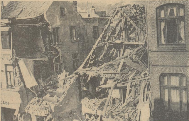
Völlig eingestürzt unter der Wirkung eines Volltreffers ist auch das Gebäude einer Möbelhandlung in der H...straße. Ueberflüssig, hier, wie überall auch zu betonen, daß die Nachbarinnen in der Nähe etwa ein lohnendes Ziel, geschweige denn ein kriegswichtiges gesucht hätten.