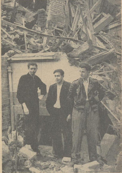
Ein eindrucksvolles Beispiel des Vorgezes, sich luftschutzmäßig zu verhalten, hat diese Schadensstelle in der B...straße. Das einem Eckhaus benachbart Gebäude erhielt einen Volltreffer. Mit ungeheuren Getöse stürzten die Stockwerke in sich zusammen. Die Bewohner (bis auf einen, der getötet wurde) hatten sich in Luftschutzraum aufgehalten. Durch den Notausstieg (siehe Pfeil auf linkem Bild) konnten sie alle wohlbehalten geborgen werden. Unser Bild rechts zeigt einige der Geretteten, die nichts ausstanden als den kurzen Schrecken.