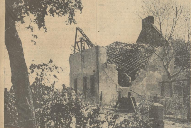
Durch englische Bomben zum Einsturz gebrachtes Haus einer kinderreichen Familie in einer bremischen Landgemeinde (ein Fall, der noch das alte Konto Churchills ziert) und —