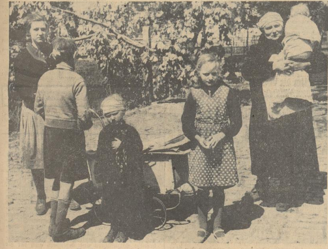
— die Familie, die glücklicherweise mit leichteren Verletzungen davorkam.