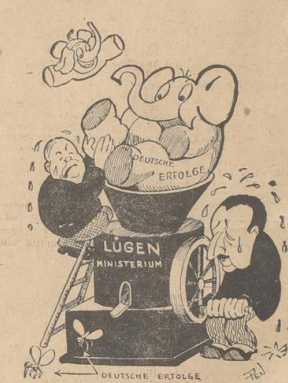
Englisches Patent: Mücken aus Elefanten

Über die „Washington Times Herald“ auf guter Quelle, die in England notuland münden und in Gefangenschaft geraten.