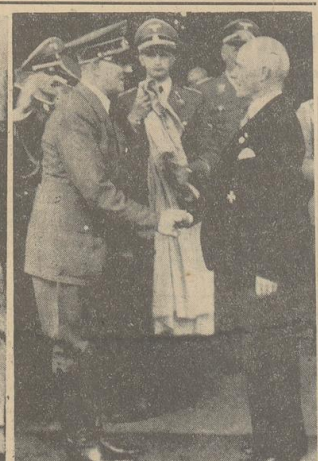
Der Führer bei Krupp. In Anschluß an den Besuch des Führers bei Dr. Krupp von Bohlen und Halbach anlässlich des 70. Geburtstages des Industriellen besichtigte der Führer eine Reihe von Werkstätten der Kruppischen Fabrik: Der Jabel der Gesellschaft umbrannt den Führer bei dem Besuch der Krupp-Werke. — Rechts: Der Führer begrüßt Dr. Krupp von Bohlen und Halbach auf der Villa Hügel in Essen. — Presse-Hoffmann (2).

Anzeigen - Grundpreise: Die 1 mm hohe und 22 mm breite Zeile im Anzeigenblatt 13 Pf. Die 78 mm breite und 1 mm hohe Zeile im Zeitblatt 75 Pf. Einmalige Grundpreise (für Klein u. Norm-) anzeigen u. a.) sowie sonstige Besondere Anzeigen 5 Pf. Nachschlag-Preise C. Für Anzeigen durch den Verleger keine Gewähr. Annehmungsloß 16 Uhr. Geschäftsstellen: In Bremen: Am Geert 10/8, Fernruf: 541 21. Hauptstadt und Sonntag: Fernruf: 511 15; Oberstraße 86, Fernruf: 541 21. In Orla: Mühlendamm Nr. 2.