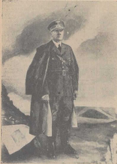
OBEN: „Der Führer und Oberste Befehlshaber der Wehrmacht“ (Conrad Hommel, Berlin).

Denkmäler deutschen Soldatengeistes / (1. BZ-Bildbericht von der heute eröffneten Münchener Ausstellung)