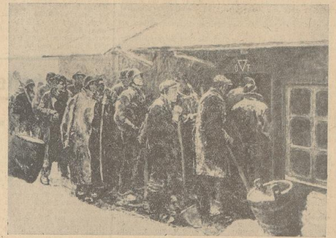
OBEN: „Die Wacht“ (Michael Mathias Kiefer, Feldwieschtiemsee).