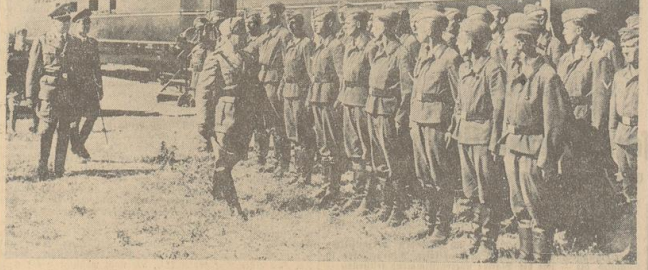
Das Geschenk des Führers an den Duce. Der Duce besichtigt — wie berichtet — einen Eisenbahnzug, der ihm vom Führer zum Geschenk gemacht worden ist.

Der italienische Wehrmachtbericht hat folgenden Wortlaut: „Das Hauptquartier der Wehrmacht gibt bekannt: Unsere Fliegerverbände haben den Marinestützpunkt Alexandria und das Petroleumzentrum von Sidi Barrani bombardiert, wobei Luftverluste erlitten und Vager sowie Reizierern in Brand gerieten. Alle unsere Flugzeuge sind zurückgekehrt. Weiter Malta ist ein englisches viermotoriges Flugzeug von unseren Kampfflugzeugen angegriffen, getroffen und schwer beschädigt worden. Ein zweites ist bei einem Angriffsvorstoß der feindlichen Luftwaffe auf Bardia durch das Eingreifen unserer Jagdflugzeuge drei englische Flugzeuge abgegriffen worden. Ein weiteres Flugzeug ist nicht zurückgekehrt. In Daitalia ist ein feindliches Flugzeug bei einem Angriffsvorstoß auf Maliana abgegriffen worden. Unsere Flugzeuge haben Jäger und Vager auf dem Flughafen von Ghedra (Libanon) bombardiert. Eine weitere H-Boote ist nicht zu seinem Zielort zurückgekehrt.“