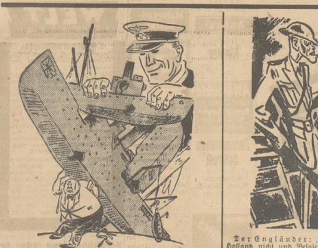
Zonnengebet — Führer zu tragen, Dr. Ewald... Zeichnung: Koba