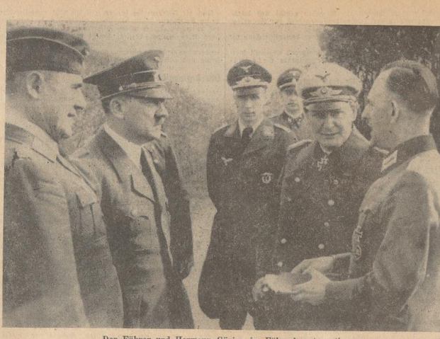
Der Führer und Hermann Göring im Führerhauptquartier