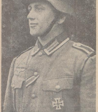
Das Antlitz des deutschen Soldaten

Der Kampf für diese Festlegung lag darin, daß unterliegt von allen Beteiligten, England und Frankreich ununterbrochen Deutschland Eroberungsabsichten in Gebieten unterworfen, die außerhalb aller deutschen Interessen liegen. Bald dies, Deutschland wolle die Ukraine besetzen, dann wieder,