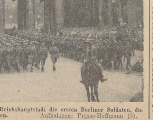
Als Sieger durch Brandenburg. So empfing die Reichshauptstadt die ersten Berliner Soldaten, die von den Schlachtfeldern ihrer stolzen Siege heimkehrten.

General Grawford hat auf Grund des Alarmzustandes in der Nacht zum Freitag für sämtliche englischen und schottischen Küsten-Bereitungsabteilungen Alarmzustand beföhlen. Die Küsten-Bereitungsabteilungen sind in Alarmzustand versetzt. Die Küsten-Bereitungsabteilungen sind in Alarmzustand versetzt. Die Küsten-Bereitungsabteilungen sind in Alarmzustand versetzt.