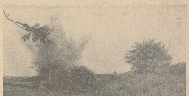
Nachdem ihm weit draußen vor der Stadt ein sicheres Grab gesehault worden ist, reißt ihm die Sprengladung in Fetzen.