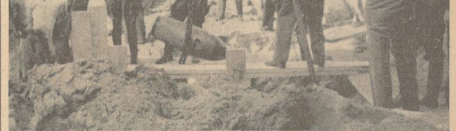
Mit dem Flaschenzug wird das nicht nur ungezogen (siehe die Siedlungshäuser im Hintergrund), sondern auch verhängerte Tommy-Ei aus seiner Verankerung gehoben.