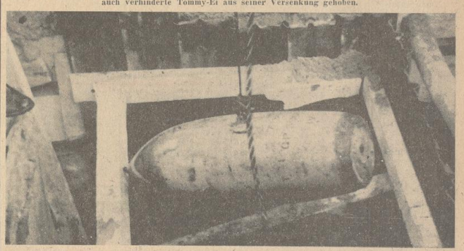
Zweiundneunzig Zentimeter hoch war dieser schwere Brocken