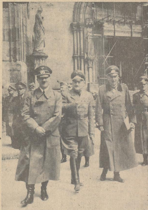
Der Führer vor dem Straßburger Münster.

Schon am 11. Juni konnten die Panzer- und motorisier- ten Infanterie-divisionen des Generals der Kavallerie von Kleist und des Generals der Panzertruppen Guderian in der Champagne mit weitestgehender Rufen über Etrones und St. Dizier ansetzen werden. Zum dritten Male ebenfalls eines Viertelhundert über- schritten deutsche Truppen die Marne. Nach anfänglich (Fortsetzung auf Seite 2)