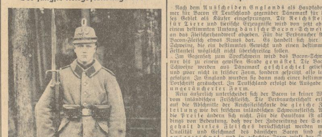
Der jüngste Kriegsfreiwillige 1914

Kriegsfreiwilliger, der im Norddeutschen Volkshaus am 2. Juli 1940 geboren wurde, ist am 4. November 1914 als Kriegsfreiwilliger in den Krieg gezogen. Er ist der jüngste Kriegsfreiwillige der Welt.