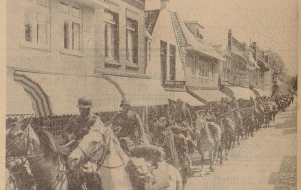
Kavallerie zieht durch einen holländischen Ort

Der Feind ist in der Lage, den Feind zu treffen. Die beiden Besatzungsmitglieder wurden durch Bombentreffer zum Schwimmen gezwungen. Die beiden Besatzungsmitglieder wurden durch Bombentreffer zum Schwimmen gezwungen.