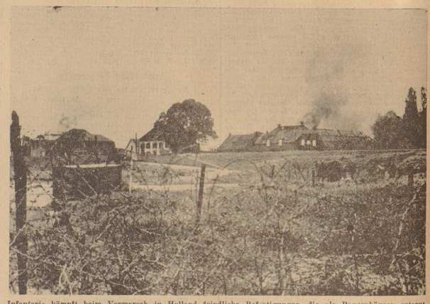
Infanterie kämpft beim Vormarsch in Holland feindliche Befestigungen, die als Bauernhäuser getarnt waren, nieder