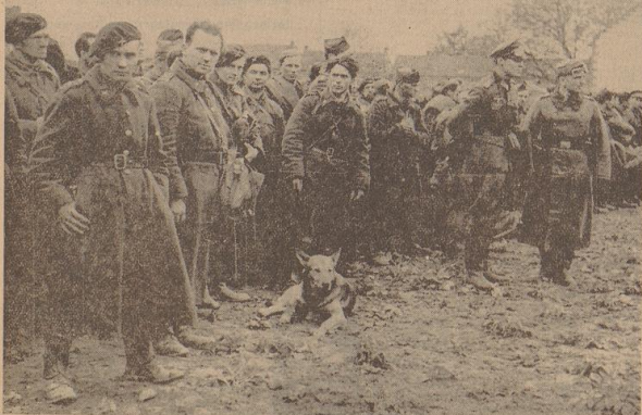
In einem Gefangenen-Sammellager.