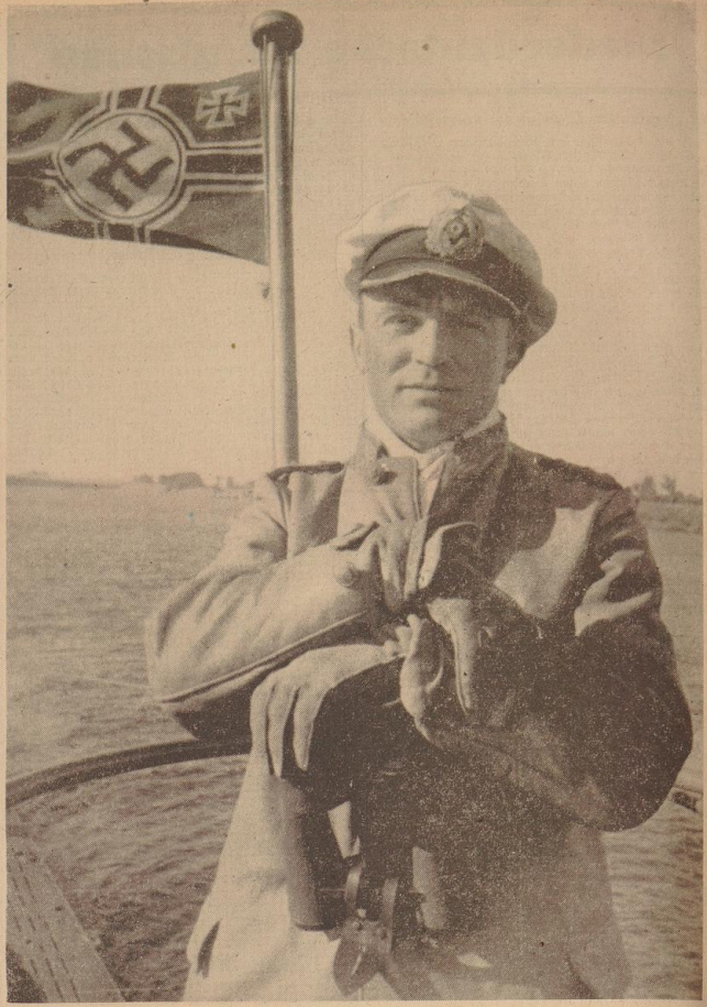
Kapitänleutnant Prien, der mit der Torpedierung und Vernichtung eines englischen schweren Kreuzers der „London“-Klasse einen neuen großen Erfolg für die deutsche U-Boot-Waffe erringen konnte.

derer bei hier vorübergeht, nie die Opfer und Leiden zu vergessen, die unsere völkerverhüllenden Brüder und Schwestern bis zum bitteren Sterben auf sich nehmen mußten.