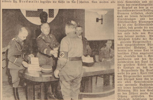
Reg. Bürgermeister SA-Gruppenführer Böhmer verabschiedet Vegeesaks Gemeinderäte und überreicht ein wertvolles Buchgeschenk