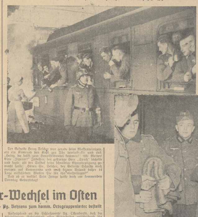
Oben: In Bremen angekommen. Der erste Weg führt den durchreisenden Urlauber zum Bahnhofssoffizier.