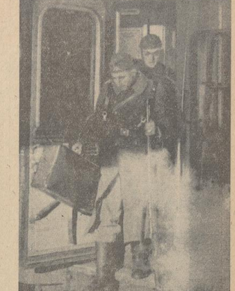
Oben: In Bremen angekommen. Der erste Weg führt den durchreisenden Urlauber zum Bahnhofssoffizier.