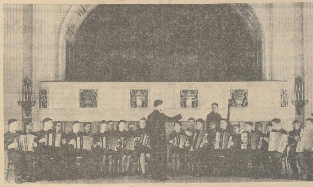
Das Akkordeon-Orchester von Weser-Flug hat in doppelter Bedeutung einen guten Klang. I Weser-Flug

Ein Betriebsrat des Ausbildungswehrs — frohe Stunden im Parkhaus