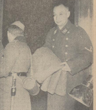
Oben: In Bremen angekommen. Der erste Weg führt den durchreisenden Urlauber zum Bahnhofssoffizier.

Bild links: Die nicht in Bremen aussteigenden, lassen sich Erfrischungen von den Rote-Kreuz-Schwwestern reichen.