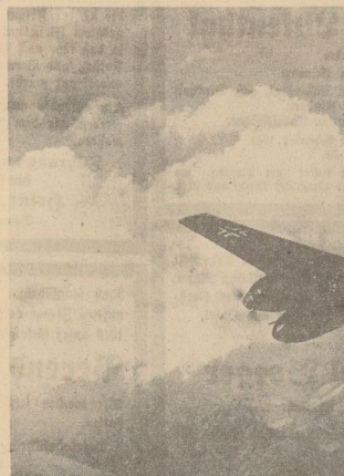
„Me 110“ auf dem Flug gegen den Feind

Diese Erfindungen beziehen sich nicht nur auf das Gebiet der Konstruktion, sondern darüber hinaus auch auf Aerodynamik, Fertigung und auf Handhabung wie Motor und Kraftübertragung. Aus dem Gebiete der Aerodynamik handelt es sich vor allem um Erfindungen, die sich mit der Erzeugung des Auftriebes und der Steuerung der Flugbewegungen und der Steuerung der Flugbewegungen und der Steuerung der Flugbewegungen befassen. Die Erfindungen beziehen sich nicht nur auf das Gebiet der Konstruktion, sondern darüber hinaus auch auf Aerodynamik, Fertigung und auf Handhabung wie Motor und Kraftübertragung.