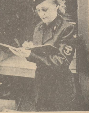
Für die Kraftfahrern der Deutschen Reichspolizei wurde diese neue, tiefschwarze Dienstkleidung geschaffen.