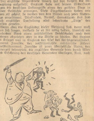
Zeichnung: Röh, /Bilder und Studien“

Der englische Botschafter in Athen hat vor kurzen die Verhandlung aufgestellt. England habe mit keinem Zweck die Verhandlung aufgestellt. England habe mit keinem Zweck die Verhandlung aufgestellt.