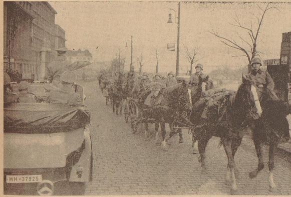
Der Führer bei seinen Truppen. Bei der Ausfahrt aus Prag begrüßte der Führer in die Stadt einziehende Truppen. — Rechts: Der Führer empfing Donnerstag nachmittag den bisherigen Staatspräsidenten Dr. Hacha in den Räumen der alten Kaiserburg in Prag.