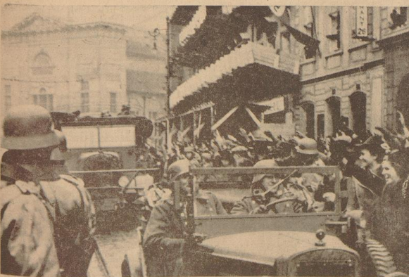
Die deutschen Truppen in Prag. Unter dem Jubel der deutschen Einwohner der Stadt ziehen die deutschen Truppen in Prag ein. — Rechts: Deutsche Soldaten besetzen die Kaiserburg von Prag