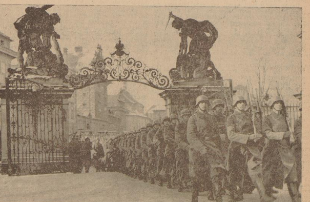
Die deutschen Truppen in Prag. Unter dem Jubel der deutschen Einwohner der Stadt ziehen die deutschen Truppen in Prag ein. — Rechts: Deutsche Soldaten besetzen die Kaiserburg von Prag