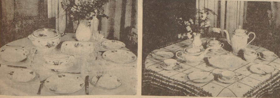
Festlicher Mittagstisch Aufnahme: Archiv (2) Der schön gedeckte Tisch, auf dem gleichzeitig Kaffee und Tee serviert ist

vereint, der Geburtstag eines Familienmitgliedes, die Rückkehr nach einer Reise, all das bietet Anlaß dazu. Um wieviel besser schmeckt es an einem schönen Tisch als an einem bedenkungslos gedeckten; wieviel froher wird die Stimmung, wenn man sieht, daß die Hausfrau sich Mühe gab, wieviel angenehmer benehmen sich die Kinder an einem solchen Tisch.