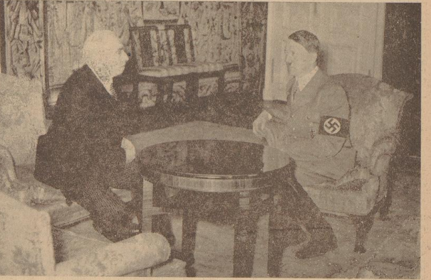
Der Führer empfing Donnerstag nachmittag den bisherigen Staatspräsidenten Dr. Hacha in den Räumen der alten Kaiserburg in Prag.