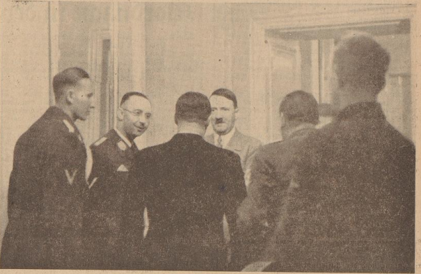
Der Führer empfängt in den historischen Räumen der Prager Burg Volksgenossen der deutschen Kolonie. Links: Obergruppenführer Heydreich und Reichsführer H. Himmler. Rechts