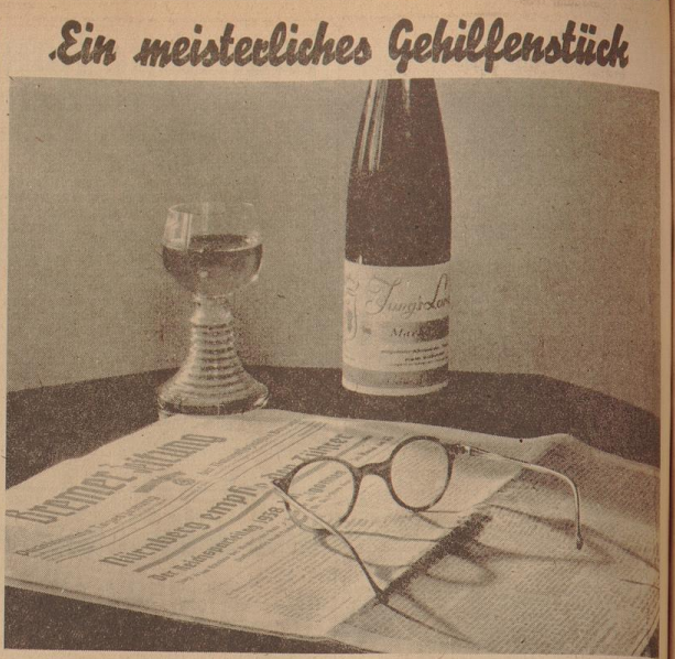
Ein Leinwand des Photographenhandwerkes, beschnitten bei Ludwig Burkhardt, Am Wall, wählte zur...