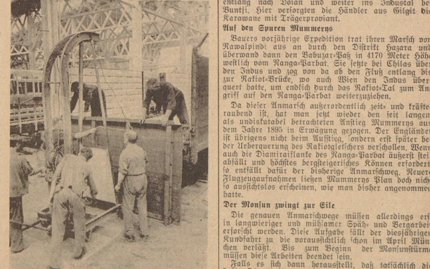
Aufbau in der Ostmark. Ein Jahr nationalsozialistische Arbeit in der Ostmark hat Erfolge gezeigt, die die kühnsten Erwartungen übertrafen haben. Links: Die Autobahn München — Landesgrenze — Salzburg im Bau. — Rechts: Hochbetrieb in den in den Heben- und Gürtelwerken (22). Sammlerwagenfabrik.